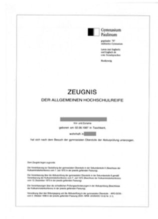
Das ist ein .....