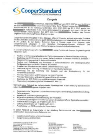
Das ist ein .....