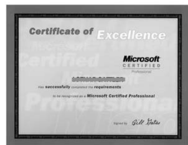
Das ist ein .....